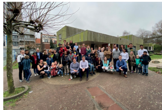
Ontmoetingscentrum 'Het Pand' in Groningen is doorgegroeid naar een geloofsgemeenschap.