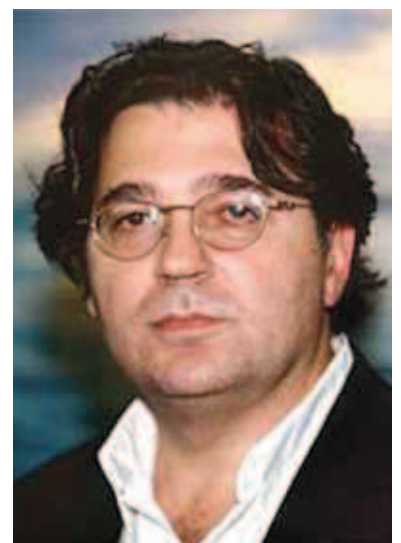
LEON DE WINTER